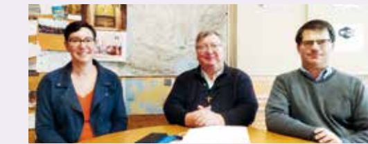
L'ÉQUIPE DES PÈLERINAGES À VOTRE SERVICE.

Pour des impératifs de législation et de fiscalité, si vous organisez pendant l'année un déplacement ou un pèlerinage pour votre paroisse ou votre doyenné, vous devez vous rapprocher du service des pèlerinages.